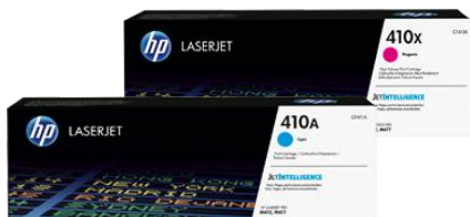
Оригинальные картриджи HP на базе технологии JetIntelligence

Используйте преимущества вашего МФУ по максимуму. Печатайте больше документов профессионального качества, чем когда-либо ранее 2 , благодаря оригинальным картриджам HP на базе технологии JetIntelligence. Оцените все преимущества высокой производительности, низкого энергопотребления и легендарного качества HP — ничего подобного конкуренты предложить не могут 2 .