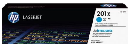
Оригинальный картридж HP на базе технологии JetIntelligence

Оригинальные картриджи HP на базе технологии JetIntelligence позволяют напечатать больше страниц 3 с максимальной скоростью и обеспечить дополнительную защиту от подделок — ничего подобного конкуренты предложить не могут.